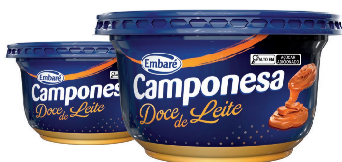
Doce de Leite Camponesa 300g (360 un.)