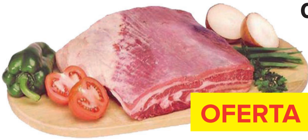
Costela Bovina com Osso Minga kg (500 kg)