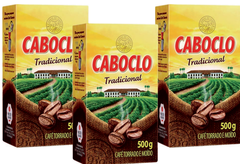
Café Caboclo a Vácuo 500g (600 un.)