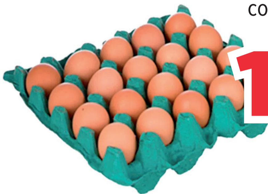
Ovos Vermelhos Bandeja com 20 unidades (500 un.)