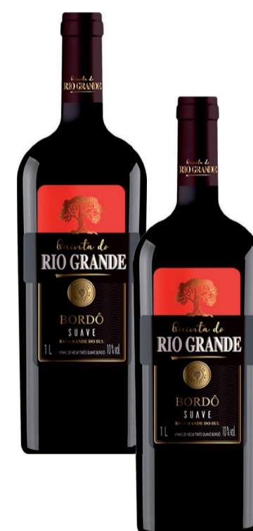
Vinho Quinta do Rio Grande 1L (300 un.)