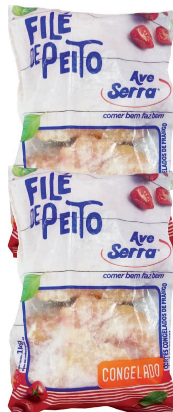
Filé de Peito de Frango Ave Serra IQF 800g (600 un.)

LEVE 4 UNIDADES ou mais PAGUE 10,75 CADA