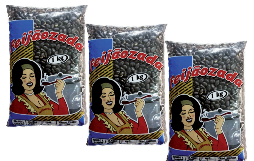
Feijão Feijãozada Preto 1kg (600 un.)

LEVE 3 UNIDADES ou mais PAGUE 10,95 CADA