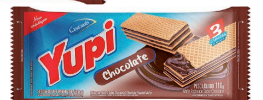
Wafer Yupi 110/115g (600 un.)