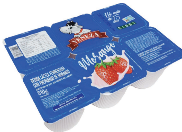
Bebida Láctea Veneza Bandeja 510g (600 un.)