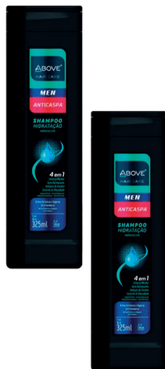
Shampoo Above Anticaspa 325ml Masculino (300 un.)