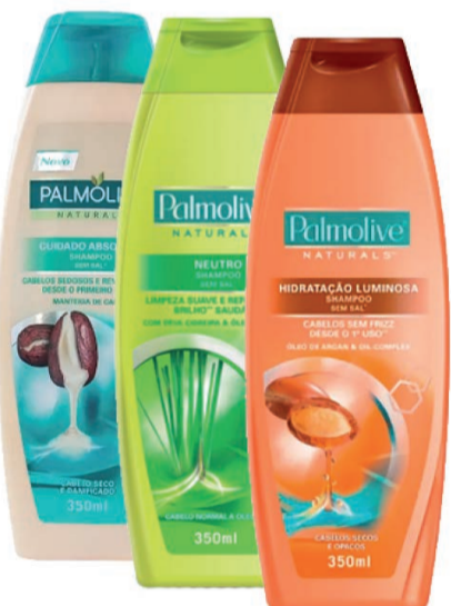
Shampoo Palmolive 325/350ml (exceto Anticaspa) (300 un.)