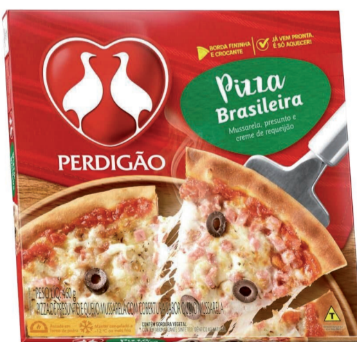
Pizza Perdigoão Congelada 460g (300 un.)