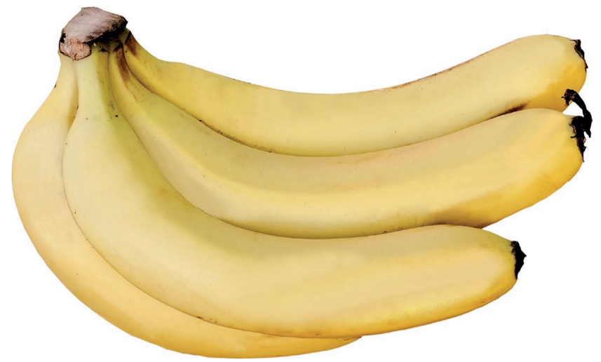
Banana Caturra Bif kg (500 kg)