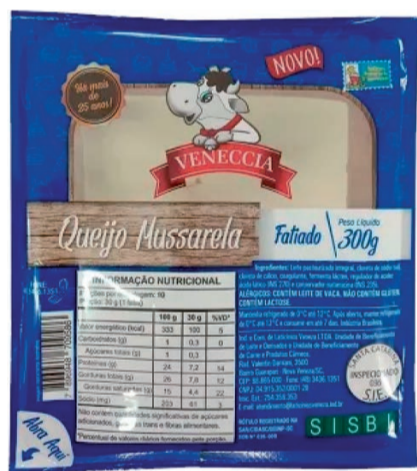
Queijo Fatiado Venecia 300g Mussarela (600 un.)

LEVE 24 UNIDADES ou mais PAGUE 0,84 CADA