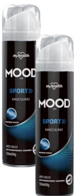
Desodorante Mood Care Aerosol 150ml (600 un.)

10,85 LEVE 2 ou mais UNIDADES PAGUE 9,85 CADA