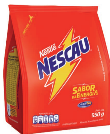
Achocolatado em Pó Nescau Sachê 550g (600 un.)