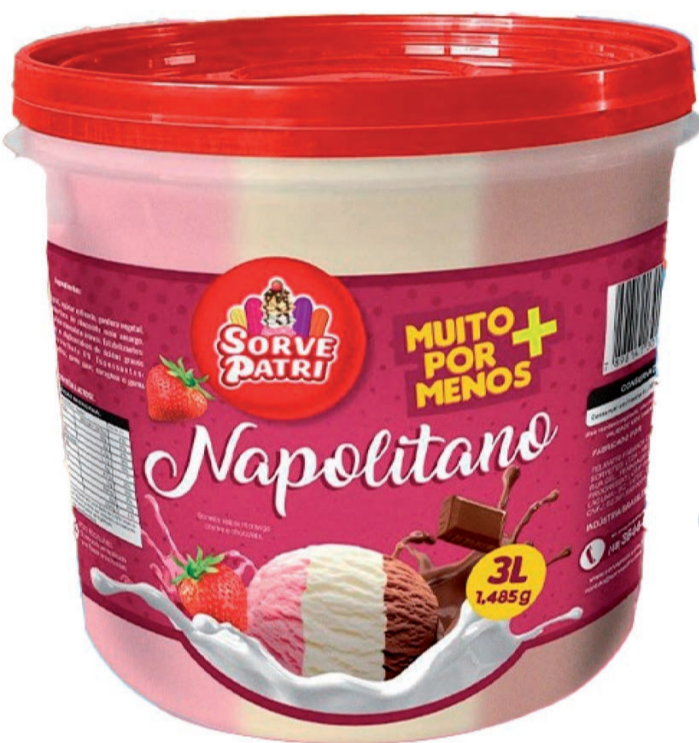
Sorvete Sorvepatri 3L (300 un.)