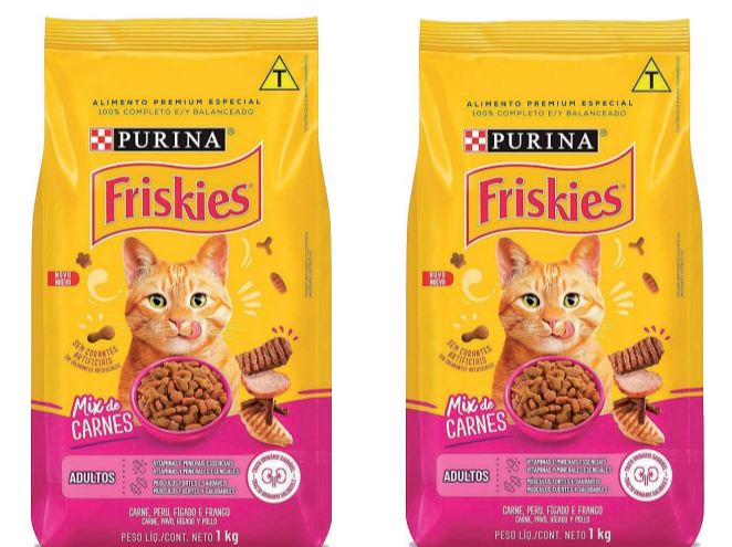
Alimento para Gato Friskies 1kg (300 un.)