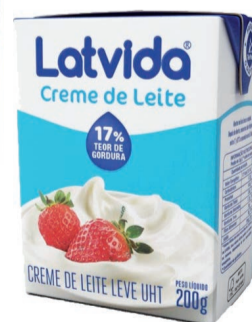
Creme de Leite Latvida 200g (600 un.)