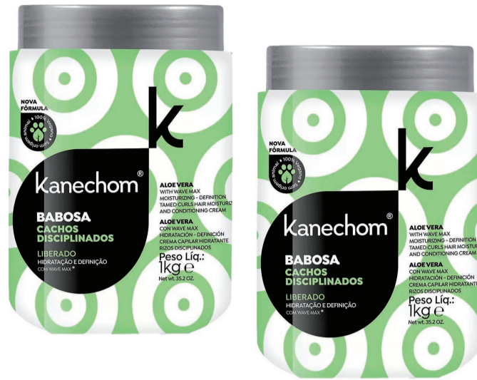
Creme Capilar Kanechom 1kg (300 un.)

1,75 LEVE 4 ou mais UNIDADES PAGUE 1,59 CADA