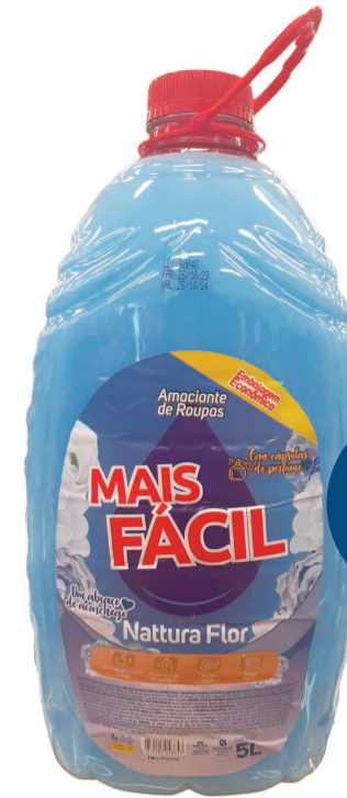
Amaciante Mais Fácil 5L (300 un.)

9,75 LEVE 2 ou mais UNIDADES PAGUE 8,85 CADA