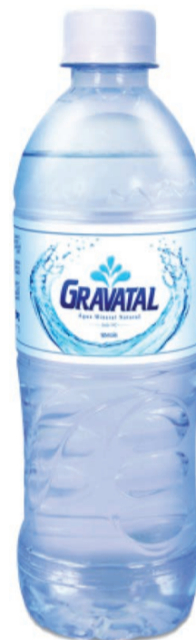
Água Mineral Gravatal 510ml Sem Gás (500 un.)

LEVE 2 UNIDADES ou mais PAGUE 22,99 CADA