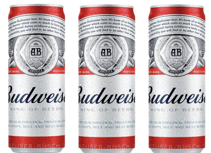
Cerveja Budweiser Lata 350ml (1200 un.)