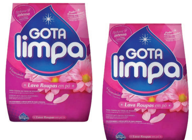
Lava Roupas em Pó Gota Limpa Sachê 800g (300 un.)