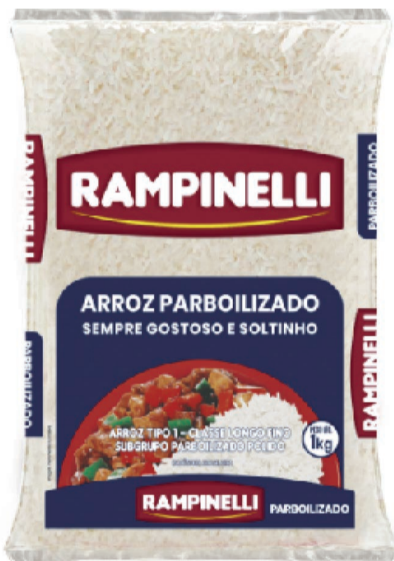
Arroz Rampinelli Parboilizado 5kg (600 un.)