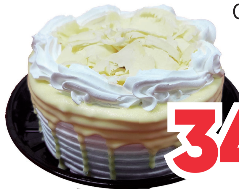
Torta Quatro Leites Castagneti kg (500 kg)

LEVE 4 UNIDADES ou mais PAGUE 20,75 CADA