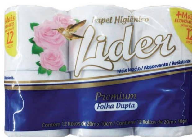
Papel Higiênico Líder Folha Dupla 20m c/ 12 unidades (960 un.)

6,95 LEVE 3 ou mais UNIDADES PAGUE 6,45 CADA