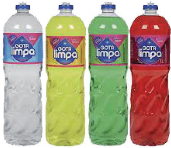
Detergente Gota Limpa 500ml (960 un.)

1,75 LEVE 4 ou mais UNIDADES PAGUE 1,59 CADA